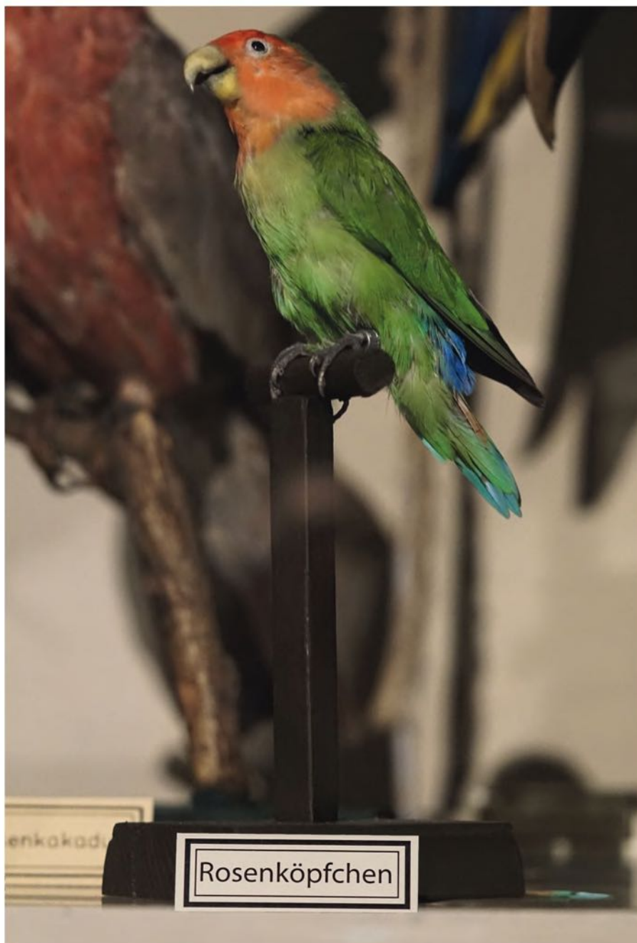
Abb. 10: Fertiges Präparat in der Ausstellung.

rationstechniken. Leitfaden für das Sammeln, Präparieren und Konservieren. Teil 1: Wirbeltiere. – Gustav Fischer Verlag, Stuttgart.