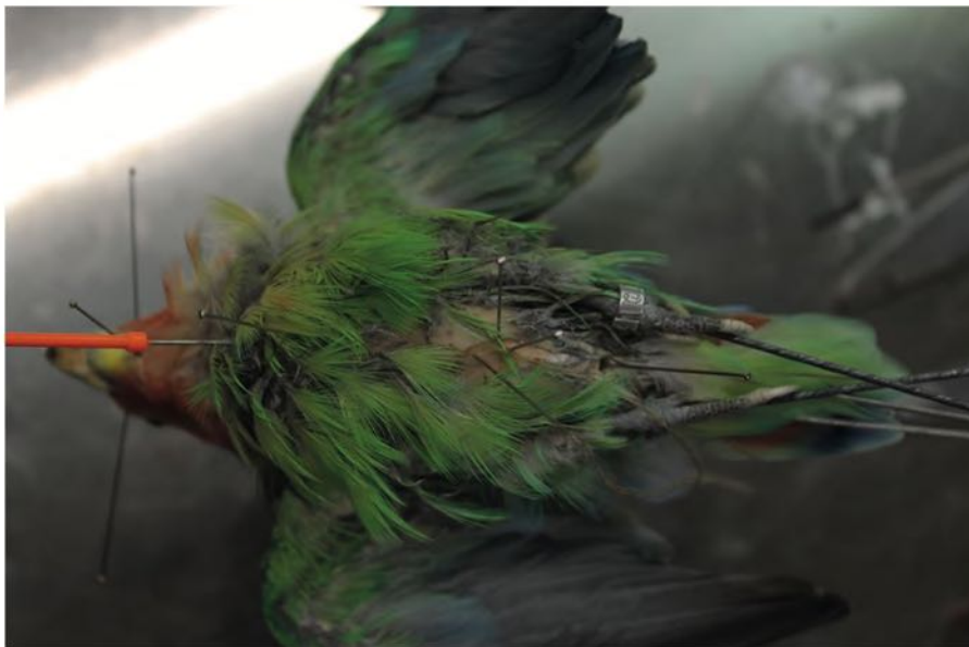
Abb. 8: Vernähen nach Einbringen des nachmodellierten Körpers.