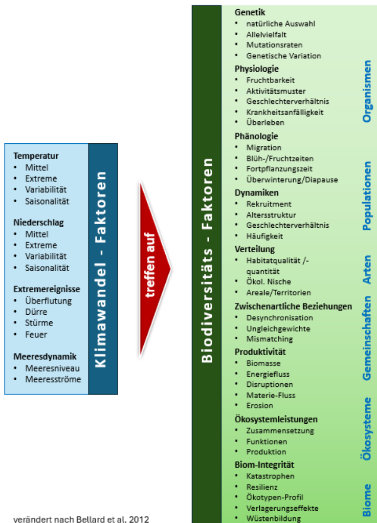
Abbildung 2: Einige ausgewählte Aspekte des Klimawandels und Beispiele ihrer möglichen Auswirkungen auf die biologische Vielfalt (verändert nach Bellard et al. 2012).

durch eine ebenfalls oft einseitig mediale Berichterstattung. Die nachhaltige Erhaltung von Pflanzen- und Tierarten muss in der Gesellschaft dieselbe Dringlichkeit und Bedeutung bekommen wie der Klimaschutz. Die Sensitivität für biodiversitätsrelevante Handlungen muss dringend erhöht werden. Das bedeutet auch, dass jede Initiative zum Ausbau von Klimaschutzmaßnahmen an ihre Naturverträglichkeit gekoppelt werden muss.